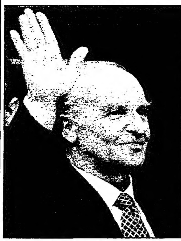
الوزير الإيراني محمد خاتمي في بيان صحفي أمس الخميس.

تهران - في بيان صحفي أمس الخميس، أكدت إيران تقديم مساعدات لاغراض انسانية. وقالت إيران إن المساعدات مقدمة لأغراض انسانية.